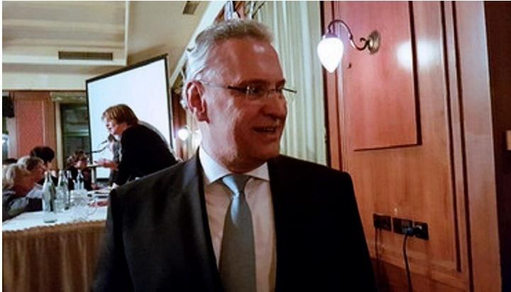
Gekommen, um wieder zu gehen: Joachim Herrmann

Vertreter der Bahn sowie Bayerns Innen- und Verkehrsminister Joachim Herrmann wollten den Planungsstand für das S-Bahn-Milliardenprojekt in München-Haidhausen vorstellen und mit den Bürgern diskutieren. Doch weil sich auf den Treppen und vor den Türen im Hofbräukeller noch etwa 150 Menschen drängten und der Saal bereits mit 500 Menschen voll besetzt war, wurde die Veranstaltung kurzerhand abgebrochen und verschoben.