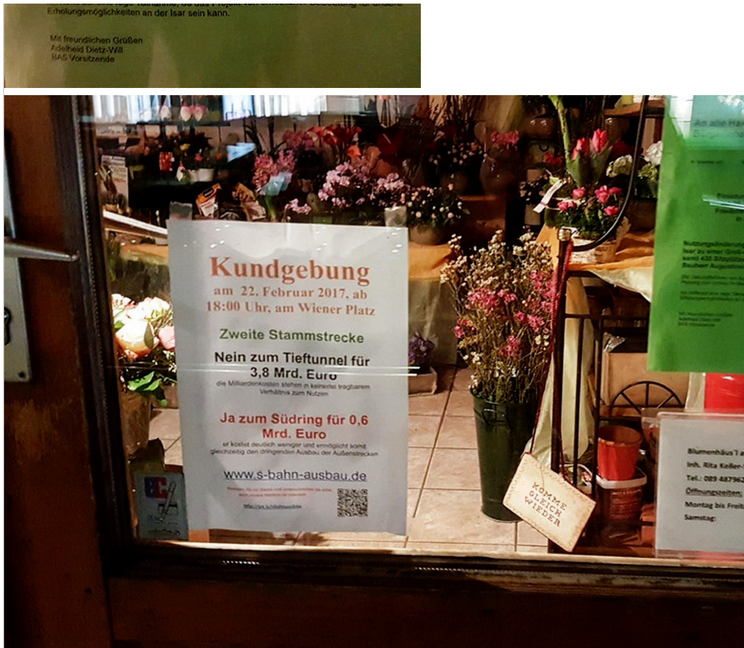
Eine außerordentliche Bürgerversammlung zum Großprojekt 2. Stammstrecke. Mit den Verantwortlichen der Bahn und dem Bayerischen Innen- und Verkehrsminister Joachim Herrmann.