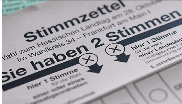
Stimmzettel der Landtagswahl Hessen 2018: Muster hier online ansehen