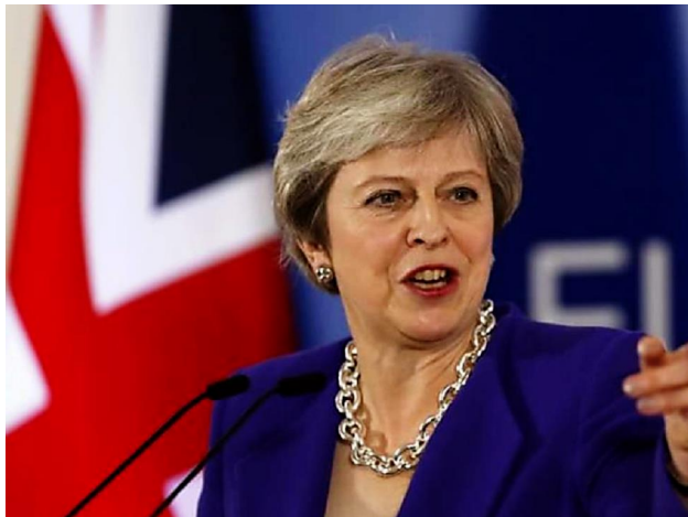
Briten wollen bei ungeregeltem Brexit Schiffe chartern