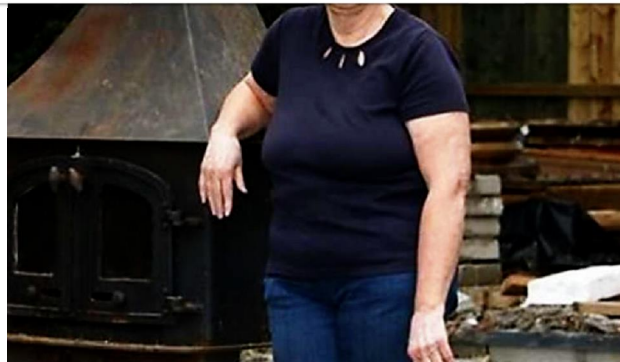
Frau muss ihr eigenes Zuhause plattwalzen - weil sie etwas Wichtiges vergessen hat