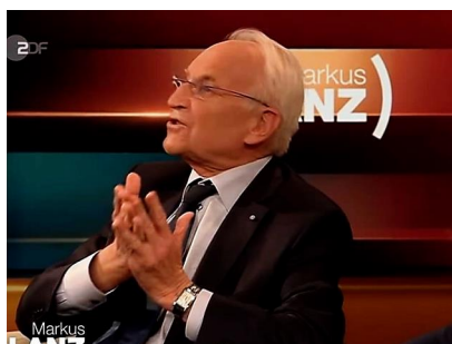
Edmund Stoiber redet sich bei Markus Lanz in Rage - dann greift er die SPD an