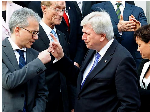
Landtagswahl 2018 in Hessen: Die wichtigsten Fakten im Überblick