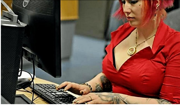
10 Besten Gratis Antivirus - Wer ist der Testsieger 2018? de.antivirustop10.com Anzeige