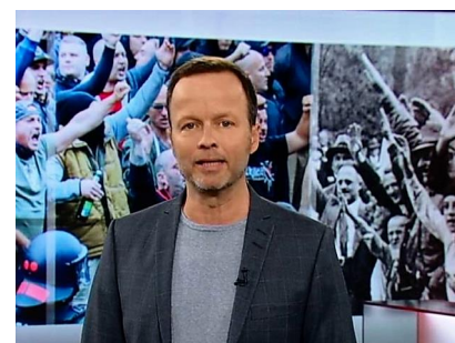
Wiederholt sich Geschichte? ARD-Magazin vergleicht 1929 mit 2018 - und AfD mit NSDAP