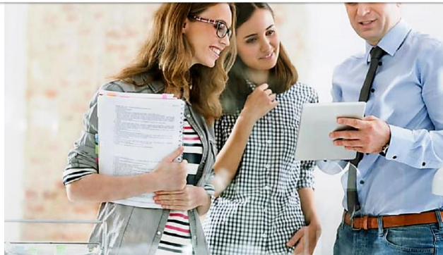
Online-Weiterbildungen: So verbessern Sie Ihre Karrierechancen!