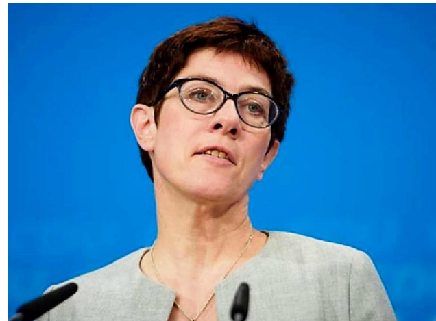
Kramp-Karrenbauer: Flüchtlingsstreit ist wie "Agenda 2010"