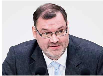
AfD-Papier aufgetaucht: Mitglieder bekommen Verhaltenstipps