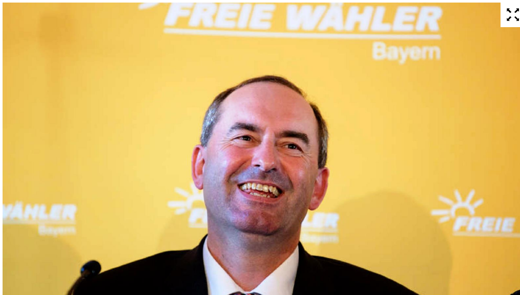
Hubert Aiwanger von den Freien Wählern.