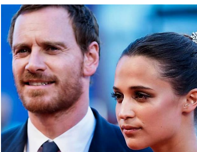
Hoher Altersunterschied: Ungewöhnliche Promi-Paare