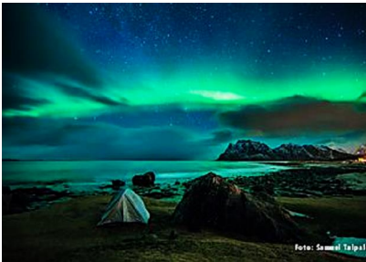
Mit dieser Airline erlebst Du Stadt, Fjord und Nordlicht auf einer Reise