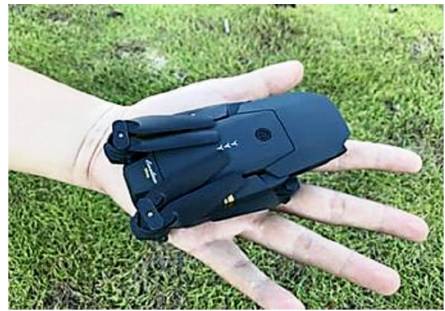
Hosensack-Drohne für 99 Euro erobert Deutschland. Die Idee? Genial