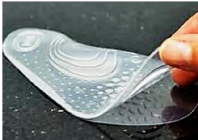
Wunder-Einlagen erobern Deutschland seit Wochen