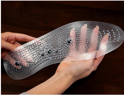
Rückenschmerzen "Kniff" macht Ärzte sprachlos www.smartertechtrends.com Anzeige