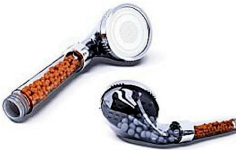
Tausende Deutsche nutzen jetzt diesen neuen Duschkopf