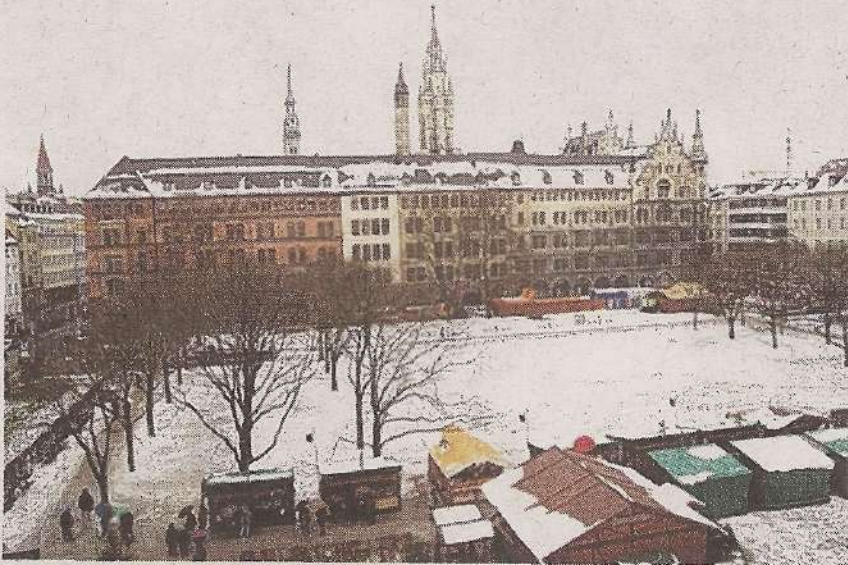
Der Marienhof: Hier soll fünf bis sechs Jahre gebaut werden. Die offene Baugrube soll 50 mal 60 Meter groß sein.

endler, Dallmayr, Gastronom Charles Schumann und Prinz Albert von Thurn und Taxis. Der Sohn von Fürstin Gloria besitzt dort ein Geschäftshaus.